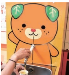
수도꼭지 굴 주스