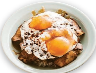
이마바리 야키부타 다마고메시