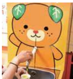
みかんジュース蛇口